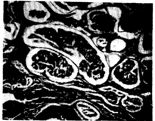
Fig. 2. Parafilaroides decorus in the alveolar spaces with inflammatory reaction. H&E. \times 100 .